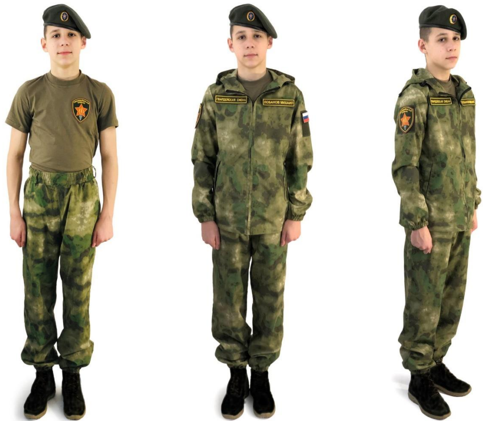
ПОЛЕВАЯ ФОРМА ОДЕЖДЫ