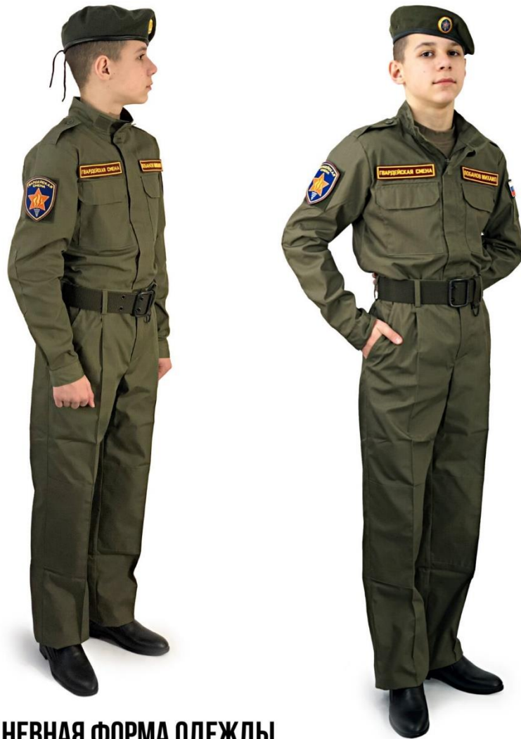
ПОВСЕДНЕВНАЯ ФОРМА ОДЕЖДЫ