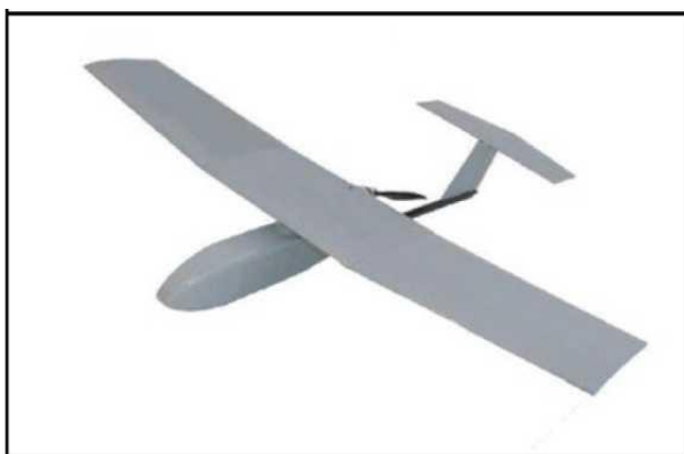
Рис. № 6 – БПЛА самолетного типа.

Существуют БПЛА, предназначенные для выполнения задач РЭР, РЭБ и связи. Скоростной диапазон работы - от 15 до 30 м/с. Рабочие высоты - в зависимости от оборудования и размеров аппарата, но всегда превышают 300 м. Обычно это диапазон высот 300 - 2000 м. Существует несколько аэродинамических схем самолетных БПЛА. Основные аэродинамические схемы – классическая (рис. № 6) и «летающее крыло» (рис. № 7).