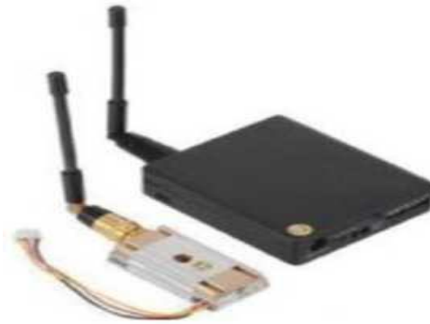
Рис. № 10 - Видеопередатчик.

Видеопередатчик (рис. № 10) - это устройство, передающее на наземную станцию изображение с камер БПЛА. Является самым заметным устройством на борту БПЛА, поэтому без необходимости включать его не стоит (это касается только тех БПЛА, которые хранят фотографии на борту), соблюдая режим радиомолчания. Такой режим уменьшает возможность применения противником средств РЭБ.