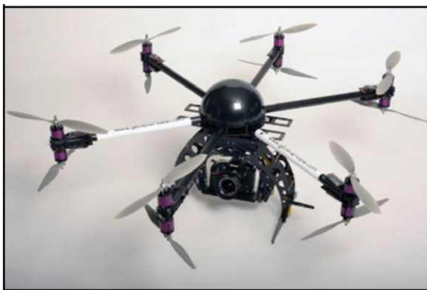
Рис. № 5 - многомоторный БПЛА.

Тип БПЛА, который с каждым днем получают все большее распространение, - многооторные системы. Их еще называют мультикоптерами, квадрокоптерами, гексакоптерами, октакоптерами и тому подобное, в зависимости от количества несущих винтов. Характерная особенность - многомоторная система, принцип полета - подобен вертолетному (рис. № 5).