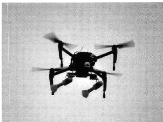
Рис. № 3 – квадрокоптер.

используют отрезок пластиковой трубы, в которой с помощью лески закрепляется граната.