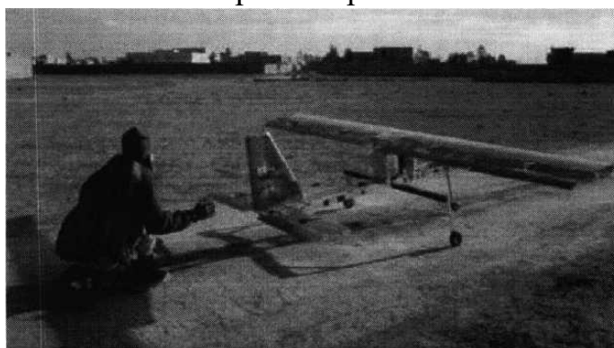
Рис. № 4 - малогабаритный летательный аппарат.

БВС-камикадзе является весьма специфичным классом беспилотной техники, информация о котором чаще всего носит секретный характер. Такой дрон представляет собой малогабаритный летательный аппарат (рис. № 4), способный нести несколько килограмм взрывчатки.