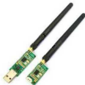
Рис. № 9 - Модем телеметрии.

Модем телеметрии (рис. № 9) - приемное устройство, предназначенное для обмена информацией между наземной станцией и БПЛА. От наземной станции он посылает команды к выполнению, от БПЛА - принимает на наземную станцию информацию, получаемую с датчиков (например, скорость, потребление тока, напряжение, положение в пространстве. Обычно является основным каналом управления БПЛА.