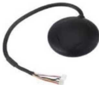
Рис. № 8 - Модуль GPS-навигации.

Рассмотрим радиопередающие системы, установленные на БПЛА.