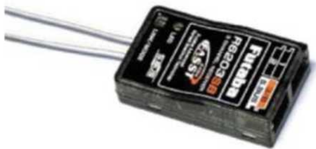
Рис. № 11 - Приемник аппаратуры управления.

Видеопередатчик (рис. № 10) - это устройство, передающее на наземную станцию изображение с камер БПЛА. Является самым заметным устройством на борту БПЛА, поэтому без необходимости включать его не стоит (это касается только тех БПЛА, которые хранят фотографии на борту), соблюдая режим радиомолчания. Такой режим уменьшает возможность применения противником средств РЭБ.