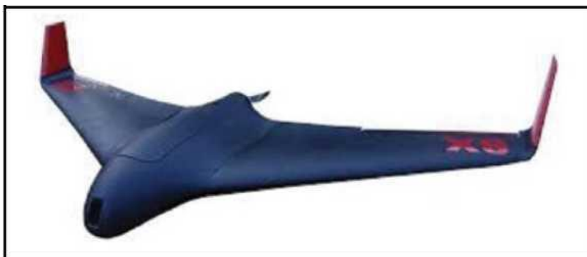
Рис. № 7 – БПЛА тип «летающее крыло».