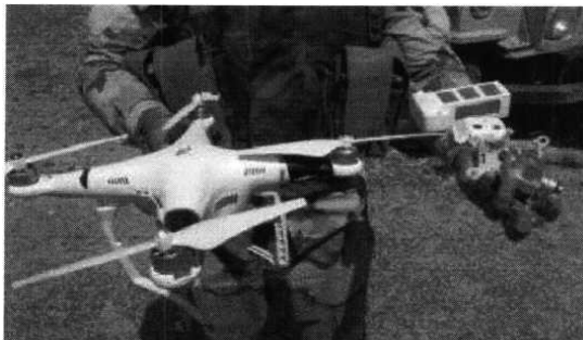
Рис. № 1 - БВС вертолетного типа.

Для совершения диверсионных актов могут использоваться БВС самолетного и вертолетного типа (рис. № 1) кустарного производства, причем доля последних значительно превышает количество самолетных. Объясняется это в первую очередь их более низкой стоимостью.