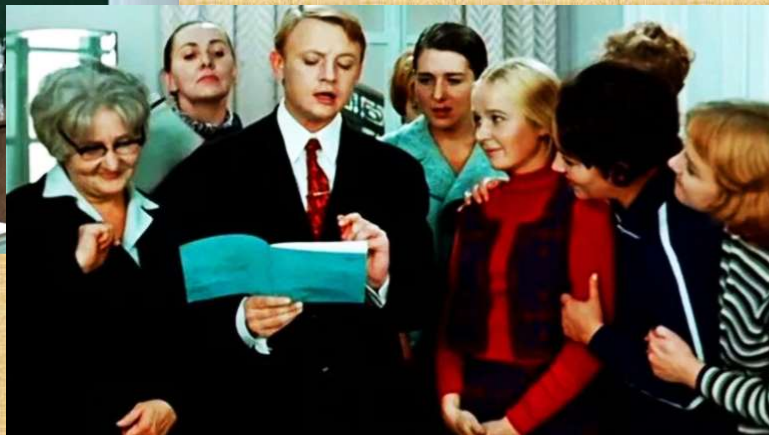
«Большая перемена», 1972 Нестор Петрович