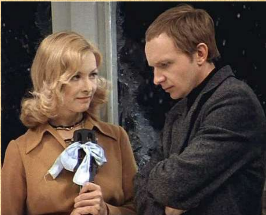
«Ирония судьбы», 1975