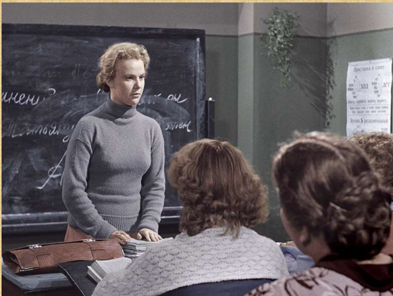
«Весна на Заречной улице» (1956 г.).