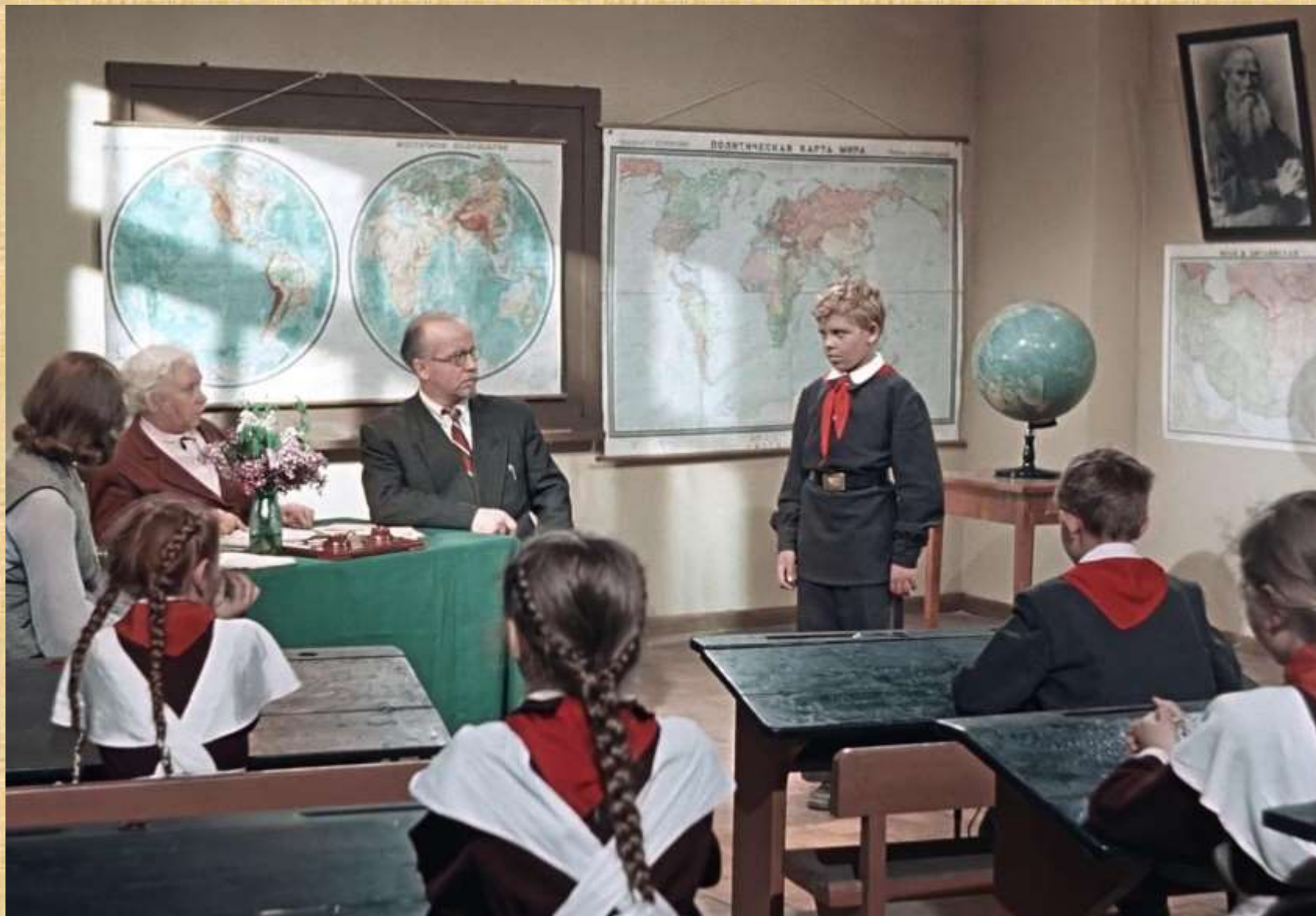
«Старик Хоттабыч», 1956