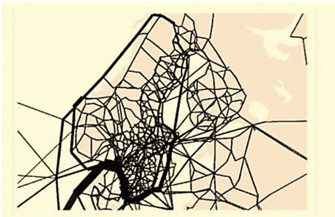
Рисунок 3.17 – Отображение грузопотоков в транспортной системе Швеции (модель SAMGODS )

В качестве другого примера можно привести разработанную Министерством транспорта США систему FAF ( TheFreightAnalysisFramework ) – основа для анализа грузопотоков), предназначенную для моделирования и прогнозирования внутренних и международных грузопотоков.